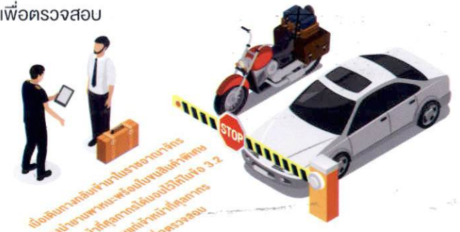
ผู้เดินทางนำยานพาหนะที่ได้นำออกไปนอกราชอาณาจักร กลับเข้ามาในราชอาณาจักร ต้องนำยานพาหนะพร้อมใบขนสินค้าพิเศษที่เจ้าหน้าที่ศุลกากรได้มอบไว้ให้ในข้อ 3.2 มอบแก่เจ้าหน้าที่ศุลกากรเพื่อตรวจสอบ

3.3 ผู้เดินทางนำยานพาหนะที่ได้นำออกไปนั้น กลับเข้ามาในราชอาณาจักรภายในระยะเวลาที่กำหนด โดยเมื่อผู้เดินทางเดินทางกลับมายังด่านพรมแดนทางบก (ไม่ว่าจะเป็นด่านพรมแดนเดียวกับที่ได้นำยานพาหนะออกไปหรือไม่ก็ตาม) ต้องนำยานพาหนะพร้อมใบขนสินค้าพิเศษที่เจ้าหน้าที่ศุลกากรได้มอบไว้ให้ในข้อ 3.2 มอบแก่เจ้าหน้าที่ศุลกากรเพื่อตรวจสอบ