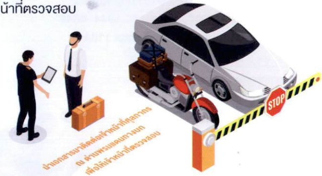
นำเอกสาร ดังข้อ 2 มาติดต่อเจ้าหน้าที่ศุลกากร ณ ด่านพรมแดนทางบก เพื่อให้เจ้าหน้าที่ตรวจสอบ

3.1 ผู้เดินทางนำยานพาหนะที่ประสงค์จะนำออกชั่วคราวพร้อมเอกสารตามข้อ 2. มาติดต่อเจ้าหน้าที่ศุลกากร ณ ด่านพรมแดนทางบก เพื่อให้เจ้าหน้าที่ตรวจสอบ