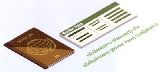
หนังสือเดินทาง (Passport) หรือหนังสือผ่านแดน (Border Pass) ของผู้เดินทาง

2.2 หนังสือเดินทาง (Passport) หรือหนังสือผ่านแดน (Border Pass) ของผู้เดินทาง ที่ประสงค์จะนำยานพาหนะออกไปนอกราชอาณาจักร ที่ผ่านการประทับตราตรวจคนออกเมืองแล้ว