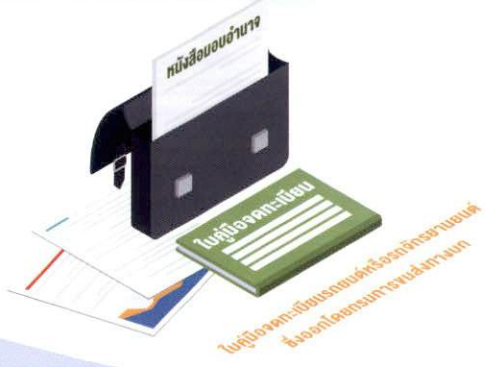
ใบคู่มือจดทะเบียนรถยนต์หรือรถจักรยานยนต์ ซึ่งออกโดยกรมการขนส่งทางบก

2.1 ใบคู่มือจดทะเบียนรถยนต์หรือรถจักรยานยนต์ ซึ่งออกโดยกรมการขนส่งทางบก กรณีผู้เดินทางมิได้เป็นเจ้าของรถ จะต้องมียังหนังสือมอบอำนาจจากเจ้าของรถที่แสดงเจตนาอนุญาตให้ผู้เดินทางนำยานพาหนะนั้นออกไปนอกราชอาณาจักรเป็นการชั่วคราว