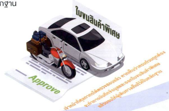
เจ้าหน้าที่ศุลกากรได้ตรวจสอบแล้ว หากเห็นว่าครบถ้วนถูกต้อง จะทำการบันทึกข้อมูลและออกใบขนสินค้าพิเศษ แล้วมอบให้ผู้เดินทางเก็บไว้เป็นหลักฐาน

3.2 เมื่อเจ้าหน้าที่ศุลกากรได้ตรวจสอบแล้ว หากเห็นว่าครบถ้วนถูกต้อง จะทำการบันทึกข้อมูลและออกใบขนสินค้าพิเศษสำหรับยานพาหนะนั้นำออกนอกราชอาณาจักรเป็นการชั่วคราว แล้วมอบให้ผู้เดินทางเก็บไว้เป็นหลักฐาน