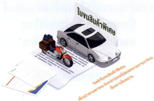
จัดทำใบขนสินค้าพิเศษ เพื่อนำยานพาหนะดังกล่าวออกไปนอกราชอาณาจักรเป็นการชั่วคราว

ผู้เดินทางหรือนักท่องเที่ยวที่เดินทางออกไปนอกราชอาณาจักรโดยยานพาหนะส่วนบุคคลซึ่งได้จดทะเบียนในประเทศไทยผ่านด่านพรมแดนทางบก สามารถปฏิบัติพิธีการศุลกากรโดยการจัดทำใบขนสินค้าพิเศษเพื่อนำยานพาหนะดังกล่าวออกไปนอกราชอาณาจักรเป็นการชั่วคราว ณ ที่ทำการของเจ้าหน้าที่ศุลกากรบริเวณด่านพรมแดนทางบก และจะได้นำยานพาหนะนั้นกลับมาภายในระยะเวลาที่กำหนด*